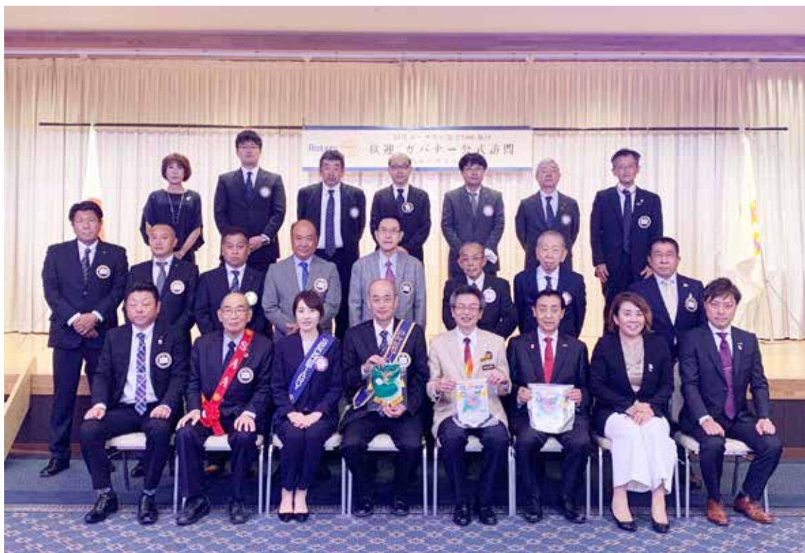
発足後初めての公式訪問を迎えた「対馬ちんぐロータリー衛星クラブ」と共同の公式訪問時の集合写真[2023年9月20日(水)]