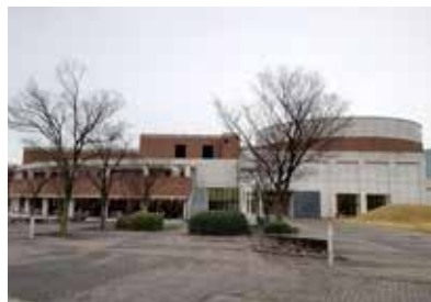
九州国際大学KIUホール(右)、食堂(左)