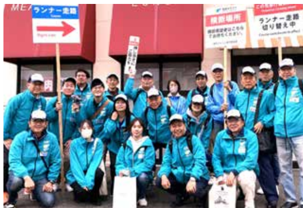
2023年11月12日(日)「福岡市民マラソン2023」