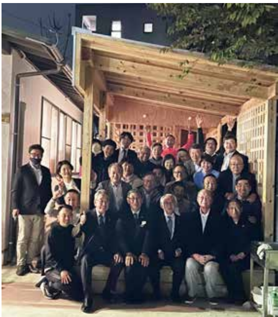
写真上 提唱校立花高等学校インターアクトクラブ 活動支援（ピザ作り体験）