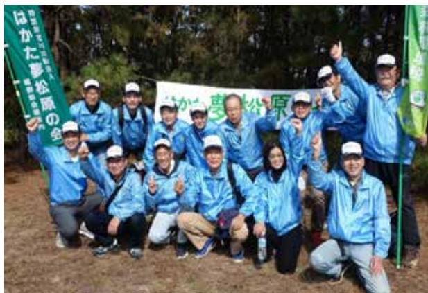
2023年11月11日(土)「海の中道海浜公園内松原間伐作業」