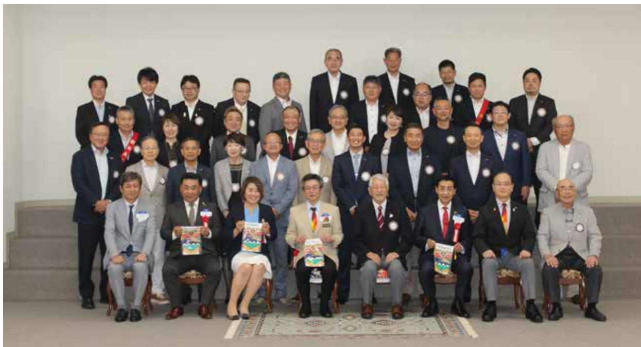
ガバナー公式訪問時の集合写真 [2023年8月2日(水)]

日本の藻場は磯焼けが進行しており毎年2〜7%ずつ減少しています。海洋国日本として、海の環境を守ることは大変重要だと考え、当クラブは藻場再生に取り組んでいます