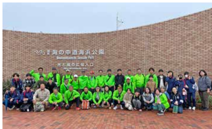
植樹・清掃活動（海の中道海浜公園 みらいの森） 活動後はBBQで親睦を深めています