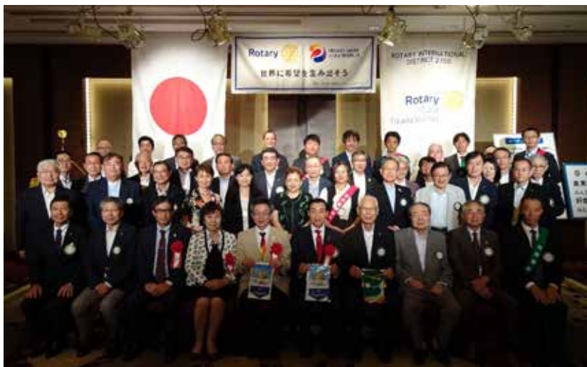
2023年9月8日(金) 吉田ガバナー公式訪問