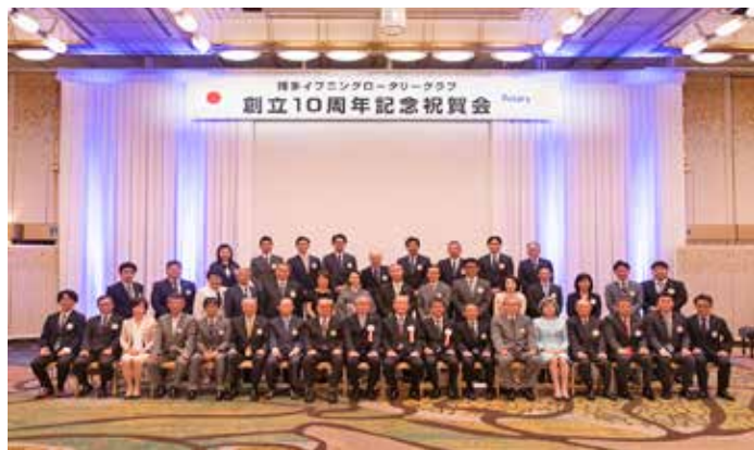
2022年6月創立10周年記念例会・祝賀会（ホテル日航福岡）