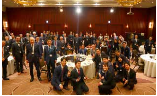
レセプション記念撮影