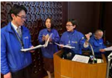
IM 開会準備 (博多 RC)

2つの講演を踏まえ、第5グループの10RCから各1名のパネラーにご登壇いただき、「ロータリーの未来をひらく」～女性会員の視点から～をテーマにパネルディスカッションを行いました。各クラブの女性会員数、入会の契機、クラブ内での活動内容、加入後のクラブの変化等ロータリー内での女性活躍の状況や要望・課題のご報告を受けて意見交換を行い、モデレーターの進行の妙もあって、実りあるパネルディスカッションとなりました。