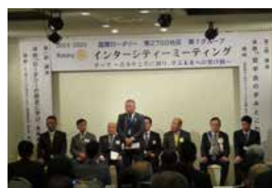
第7グループ IM 参加クラブ及び RAC 紹介