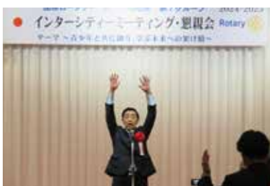
ガバナーエレクト万歳三唱