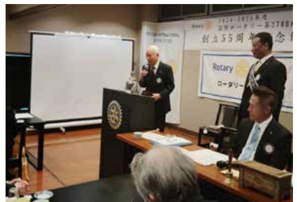
永年在籍会員井ノ口会友