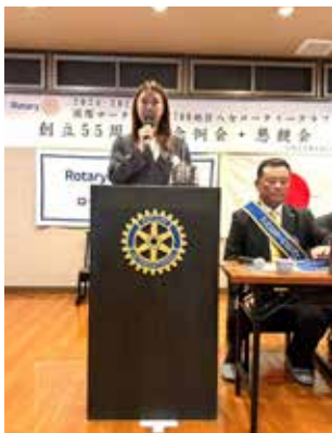
蒲池創立 55 周年実行委員長

楽しさの中にも、厳しさを持ち合わせた八女ロータリークラブです。地区の皆さま、今後ともご指導ご鞭撻の程、よろしくお願いいたします。