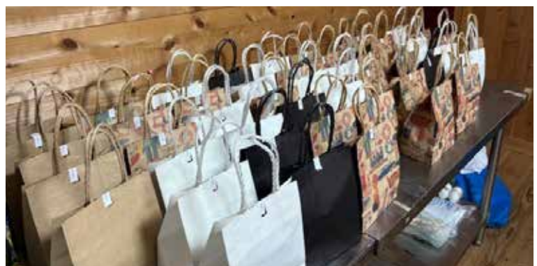
記念事業 / しののめ共同作業所 お菓子詰め合わせ (記念品配布用)