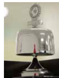
若松ロータリークラブの鐘