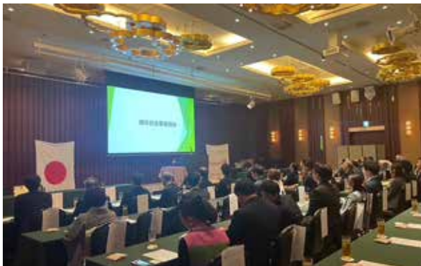
周年記念事業報告