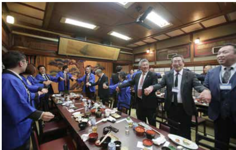
全員で「手と手をつないで」