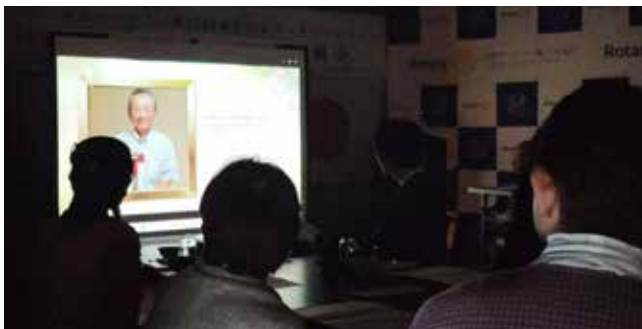
物故会員を偲ぶ映像