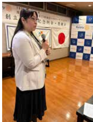
記念懇親会司会 久保実行委員会委員