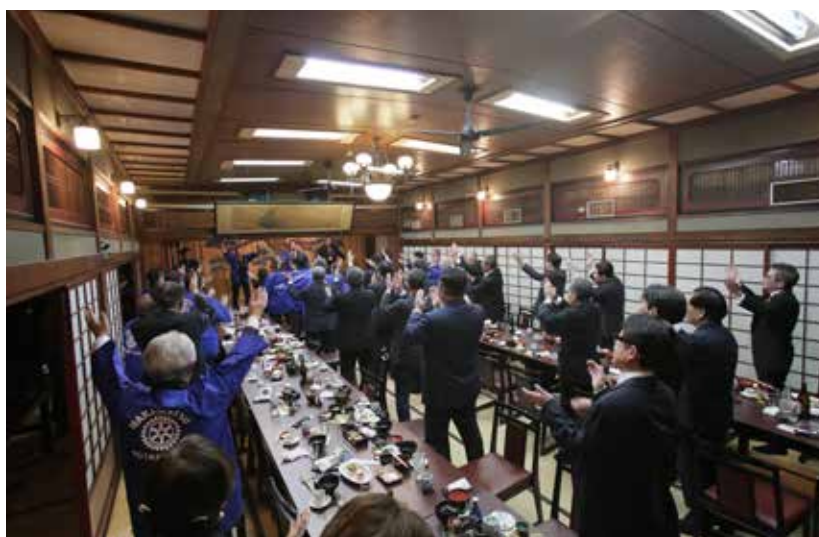
今村ガバナー補佐、谷副会長、津田会員による「あびす打ち込み」にて中締め