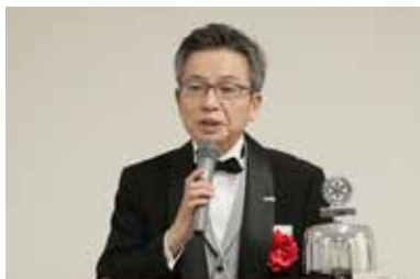
吉田副ガバナー ご祝辞