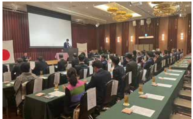
ローターアクトクラブ会長挨拶