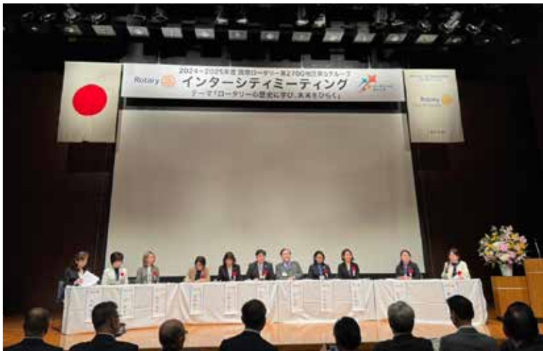
パネルディスカッション