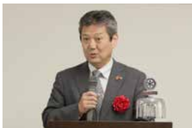
奥野若松区長 ご祝辞