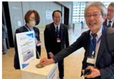
志岐高校・選抜支援カンパ (第5G)