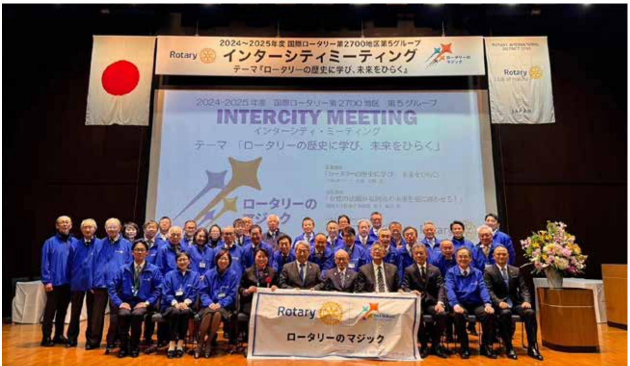
ホストクラブ (博多 RC) の皆様