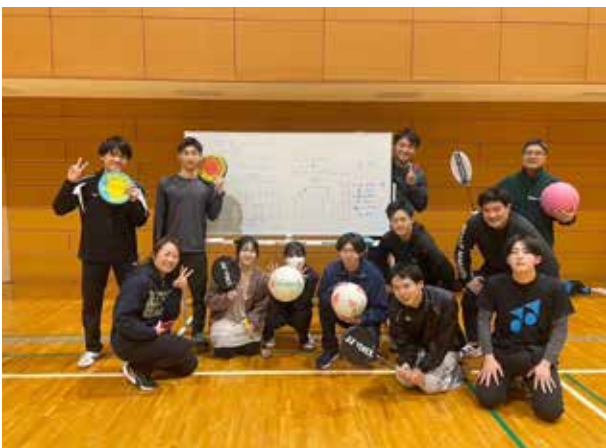
スポーツ例会の様子

今後の活動方針としては、地域との交流を行うことです。帝京大学福岡キャンパスは医療系、福祉系の大学です。考えている案としては、老人ホームに出向いてかるた大会やお手玉といった、昔ながらの遊びを利用者の方と一緒にやりたいと思います。また、大学周辺のごみの散乱が最近になり目立ち始めているため、大学周辺の清掃活動も積極的に行っていきます。自分の周りから活性化していき、地域に貢献できるように日頃から努力していきます。