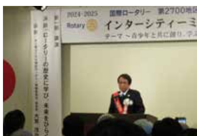
ガバナー補佐挨拶