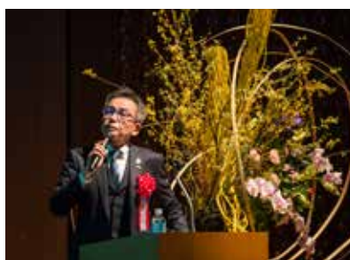
吉田直前ガバナー