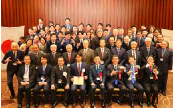
参加者で記念撮影

し、社会奉仕・親睦を深めることに努めてまいります。 今後ともご指導ご鞭撻のほどよろしくお願いいたします。