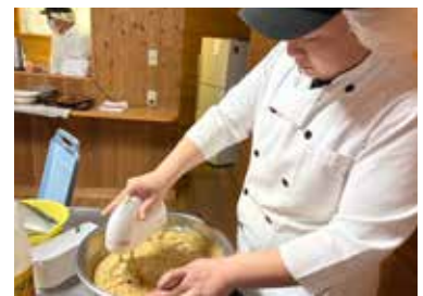
記念事業 / しののめ共同作業所 作業