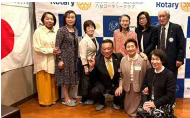
物故会員の奥様と会員奥様