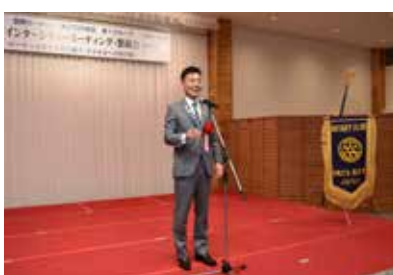
ガバナー挨拶・乾杯