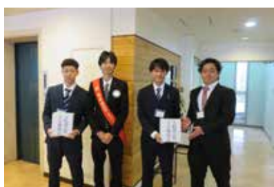
大船渡森林火災支援金のお祝い (RAC・米山記念奨学生)