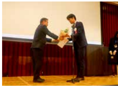
提唱ロータークラブ会長に感謝状と花束贈呈