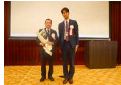
ローターアクトクラブ会長と提唱ロータークラブ会長記念撮影