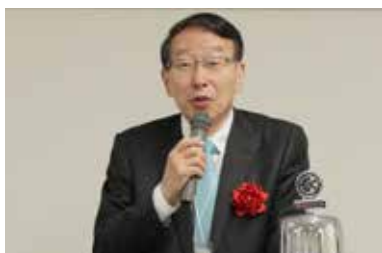
スポンサークラブ福岡 RC 柴戸会長 ご祝辞