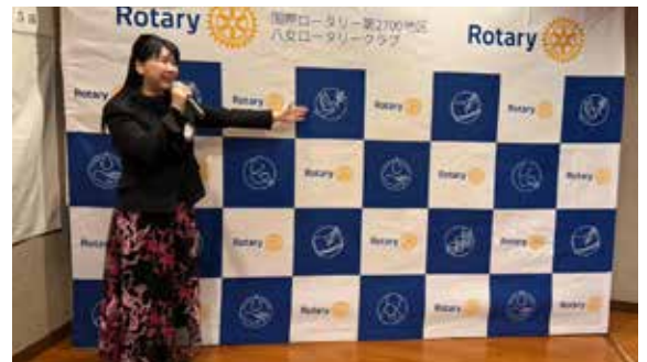
平田実行委員会オブザーバー