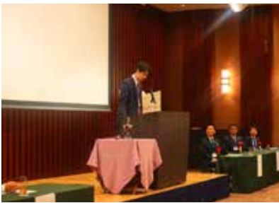
ローターアクトクラブ会長挨拶

記念式典においては、ガバナーはじめたくさんの方にお祝いのお言葉を頂戴し、普段の活動のなかではなかなか見えない方々も含めてたくさんの方の支えの中で、私たちは活動ができていることを改めて実感しました。OB・OGの方にもたくさんお越しいただき、懐かしいようでほんの少し前まで一緒に活動してきた先輩と気恥ずかしさもありながら笑顔で過ごせた素敵な時間でした。他のローターアクトクラブ会員もたくさんご参加いただき式典を大いに盛り上げてくださいました。レセプションでは冒頭でチャーターメンバーはじめOB・OGの方々よりご提供いただいた映像や写真から動画を作成し、参加者のみなさまにご視聴いただき、福岡城西ローターアクトクラブの50年間のあゆみに触れる時間を設けさせていただきました。当時の記憶に