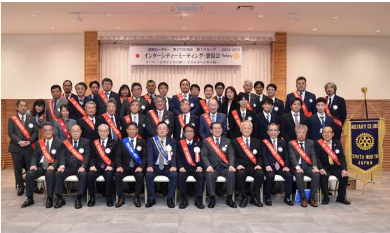
第7グループ IM ホストクラブ大牟田北ロータリークラブ集合写真