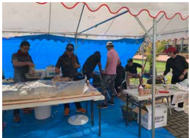
帝京祭の準備の様子