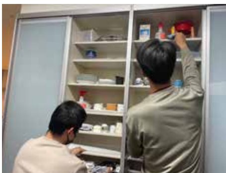
記念事業 / ドナルドマクドナルドハウスボランティア