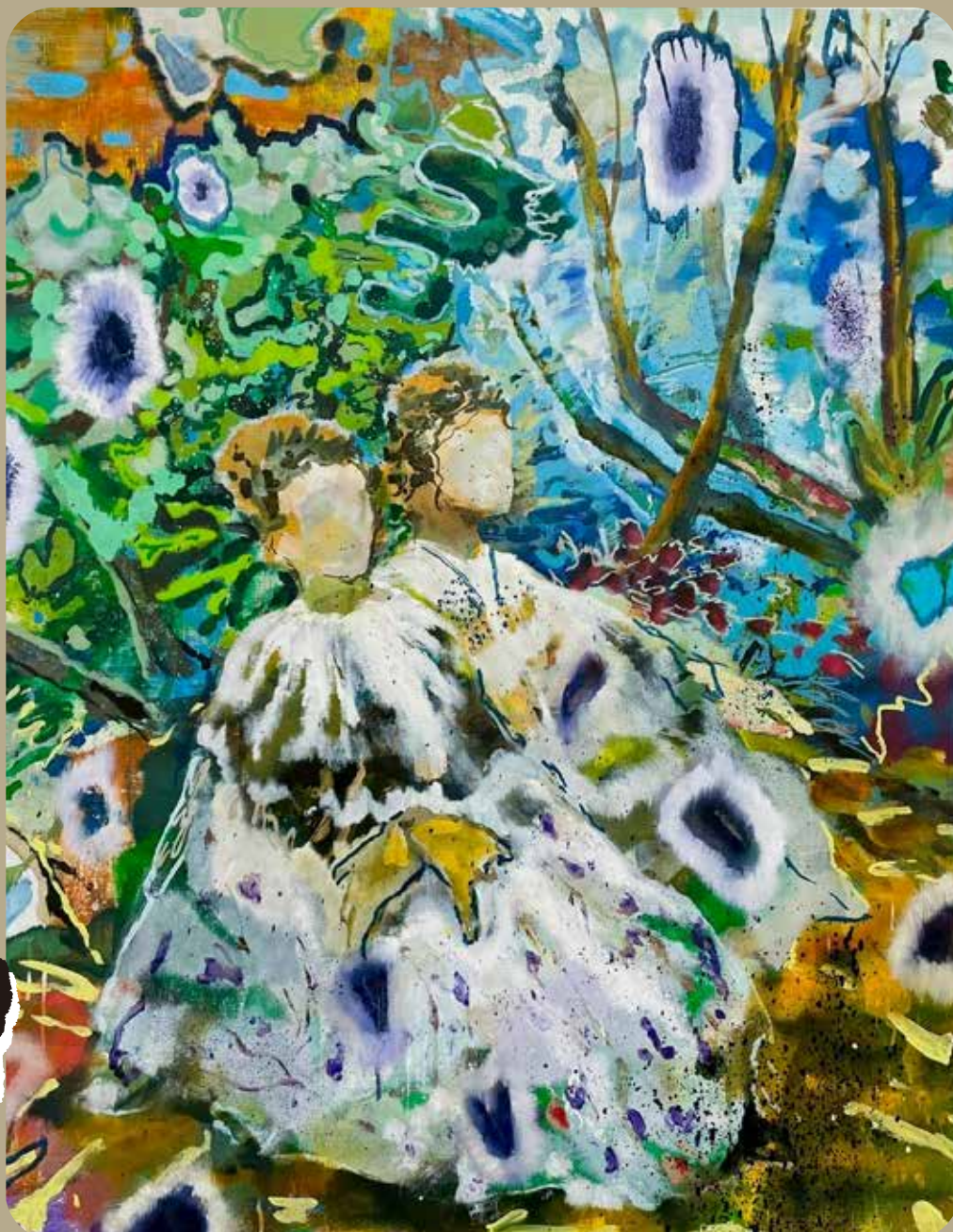
絵：上田健太 UEDA, Kenta