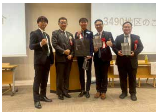
第3490地区（台湾）のロータリアンの皆様と

卓話をいただいた後、各RAC会長陣によるクラブ紹介に移りました。各クラブにおける活動方針やさまざ