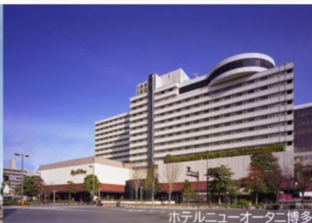
ホテルニューオータニ博多

会場：電気ビル共創館&みらいホール・ホテルニューオータニ博多 ホスト地区：国際ロータリー第2700地区