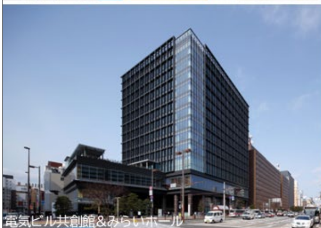
電気ビル共創館&みらいホール