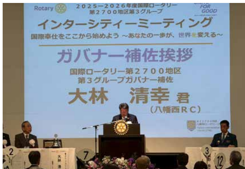
大林ガバナー補佐挨拶