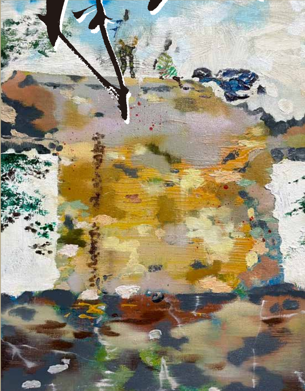
絵：上田健太 UEDA, Kenta