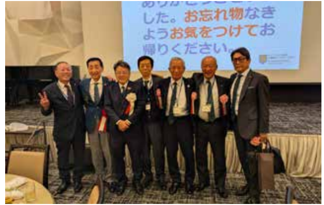
地区ガバナー補佐集合写真