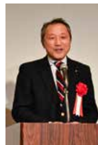
ガバナー補佐エレクト 藤瀬 貴美也