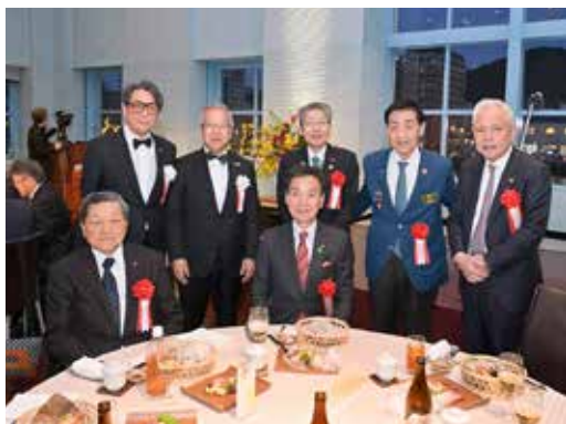
ガバナー・副ガバナー・バスターガバナー・ガバナー補佐・地区幹事・門司西 RC 会長 集合写真