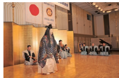
記念公演「能 高砂」鷹尾会長他能楽師の皆さん