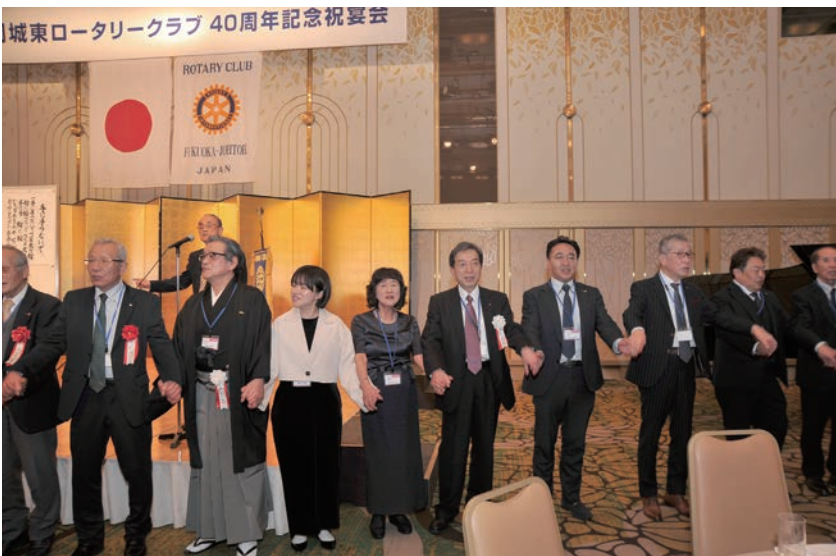
祝宴終了後参加いただいた皆様と「手に手つないで」で無事終了