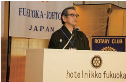
40周年記念式典、鷹尾会長挨拶

今後も「文化を通じて心を豊かに」という理念のもと、会員一同心を一つに、地域社会と世界に貢献するクラブとして、さらなる発展を目指してまいります。