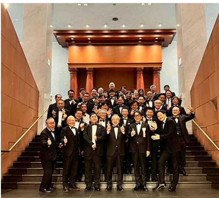
門司西 RC・門司西 RAC・門司西めかり RSC 集合写真