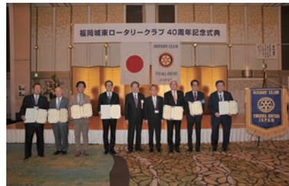
歴代会長、幹事（30代～39代）へ感謝状贈呈