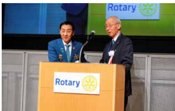
ガバナーエレクト紹介

なお、大会ではポリオ根絶活動への支援として、友愛広場にて募金活動を行い、総額44,002円のご寄付をいただきました。ここに全額を公益財団法人ロータリー日本財団のポリオプラス基金に寄付させていただきましたことを紙面にてご報告申し上げます。ご協力を頂きました皆さま、ありがとうございました。