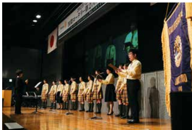
オープニングセレモニー NHK福岡児童合唱団MIRAI