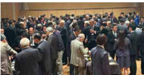
満席の懇親会会場