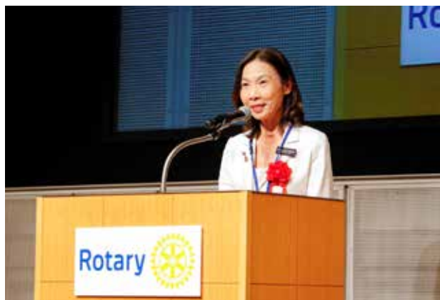
第3481地区との姉妹地区締結報告