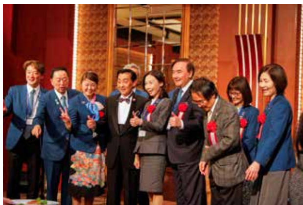
会員交歓会での第3481地区台湾の皆さま