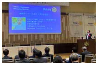
アルアーマド・ラジ様基調講演