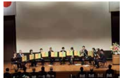
九州電力吹奏楽部の演奏