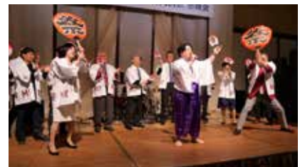
行橋みやこ RC カラオケ