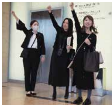
女性会員による本番前のガンパローコール