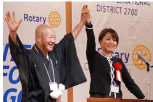
第4G ガバナー補佐引継式福岡城南RCへ