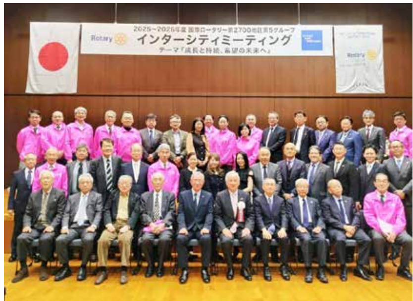
ホストクラブ (福岡北 RC) の皆様