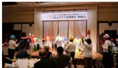
行橋 RC カラオケ