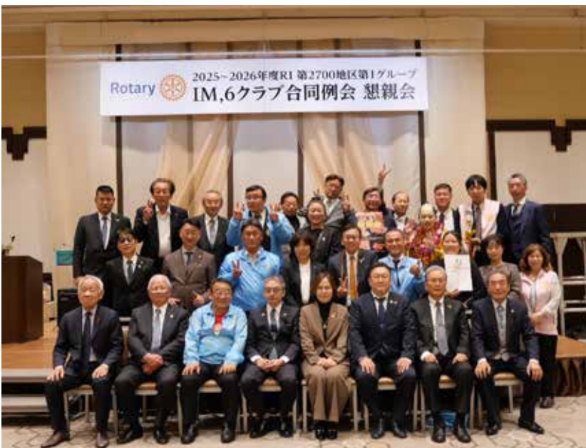
終了後の集合写真