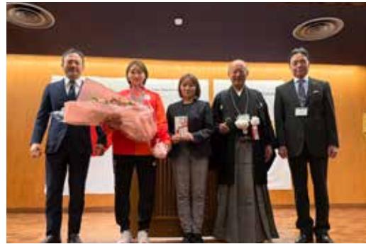
デフリンピック金メダリスト矢ヶ部真依選手お礼挨拶