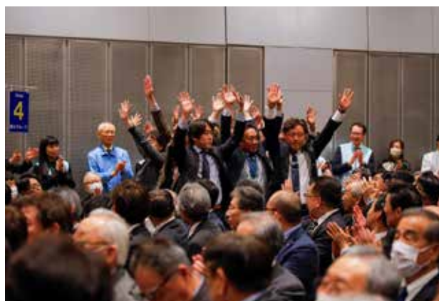
福岡エアポート RC の皆さま