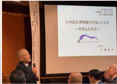
九州国立博物館初代館長 三輪嘉六様講話