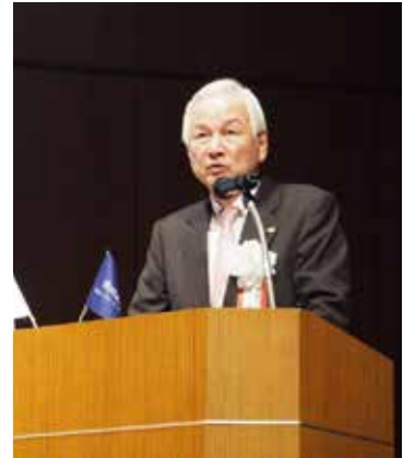
開会の言葉 (福岡北 RC 相良会長)