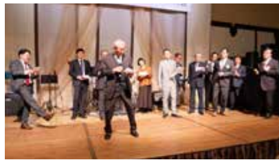
田川 RC カラオケ