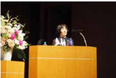
記念講演 (伊豆宗像市長)