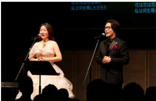
アトラクション HUEによるデュエット