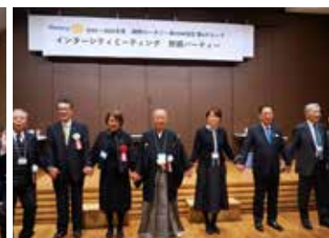
手に手つないで 会場全体から通路までの大輪