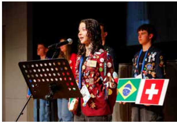
国際青少年交換学生スピーチ