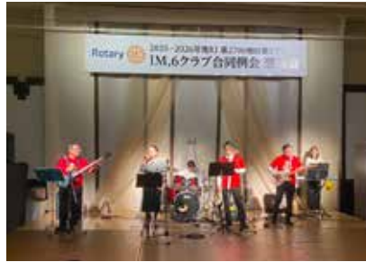
ハッピーハーツクラブバンド