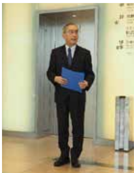
梶原実行委員長による事前ミーティング