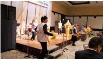
行橋コスモス RSC カラオケ