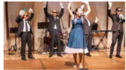
豊前西 RC カラオケ