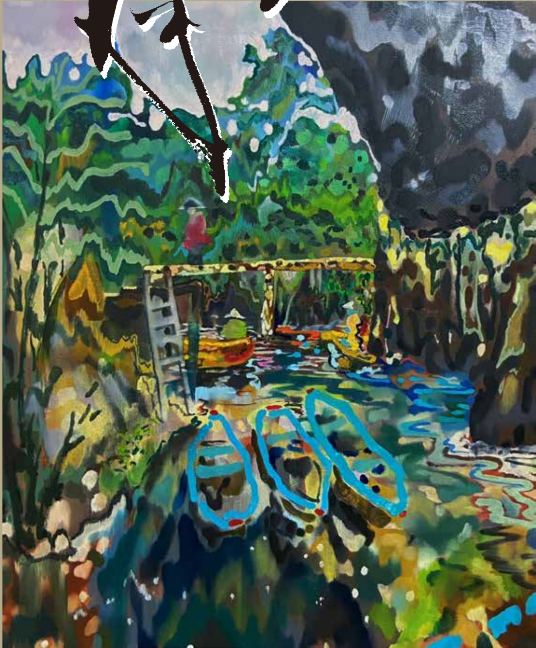
絵：上田健太 UEDA, Kenta