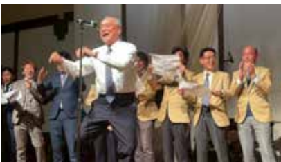
苅田 RC カラオケ