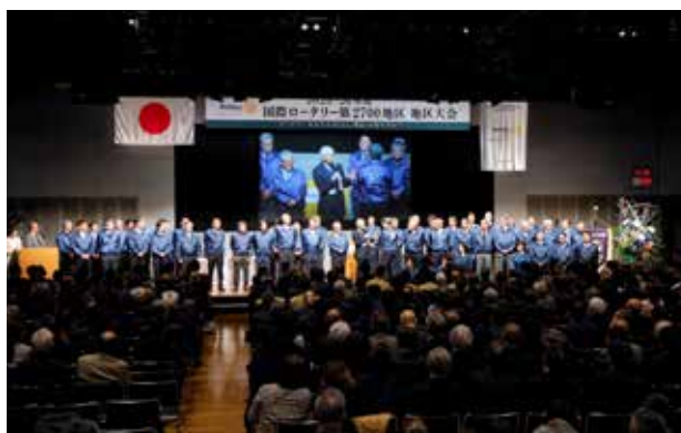
次年度地区大会ホストクラブ紹介