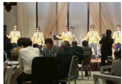
豊前 RC カラオケ