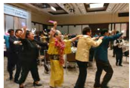
濱野ガバナー率いるトレイン