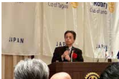
JR九州 古宮社長特別講演